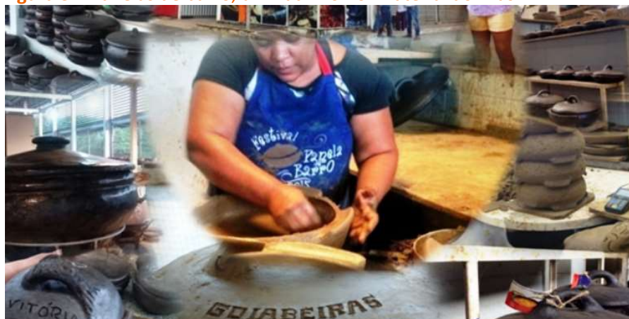
Figura 3 – Panelas de barro, um Patrimônio Imaterial do Brasil