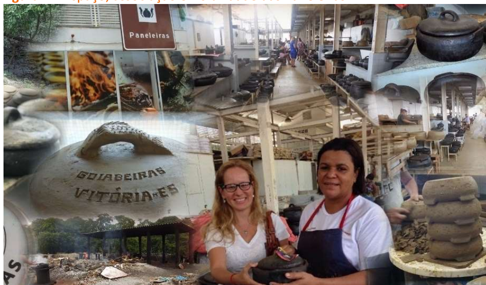
Figura 2 – Espaço, associação e visibilidade das Paneleiras