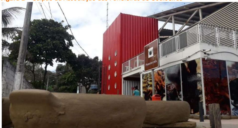
Figura 1 – Galpão da Associação das Panelleiras de Goiabeiras