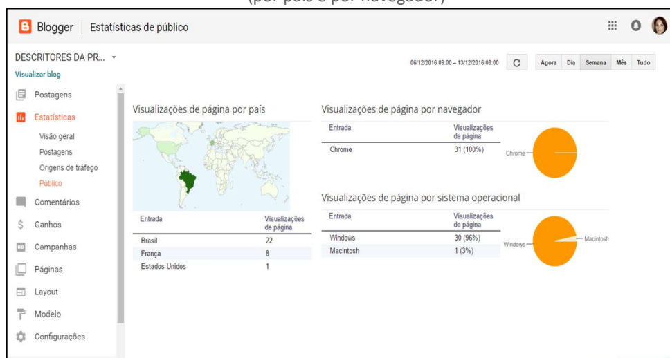
Figura 9 – Estatística: número de visualizações das páginas do blog (por país e por navegador)