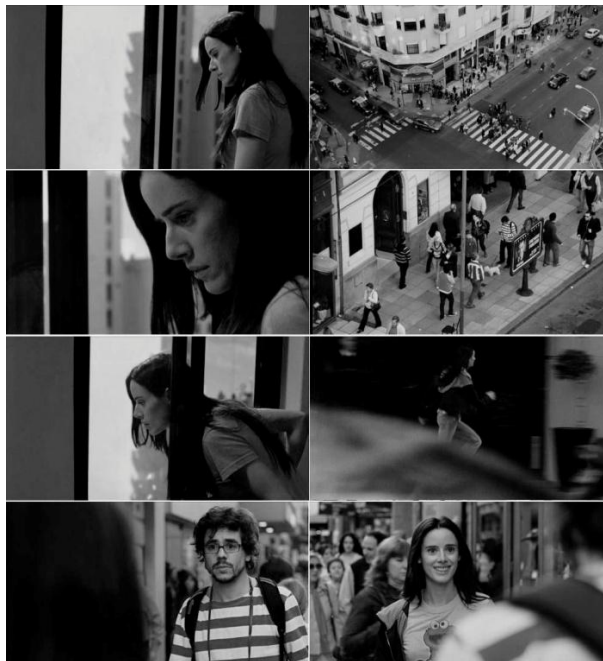
Figura 5: Frame do filme Medianeras : Movimento olhante e olhado – Flâneur e Transeunte.

Caetano e Fischer também analisam a posição daquele que é observado: