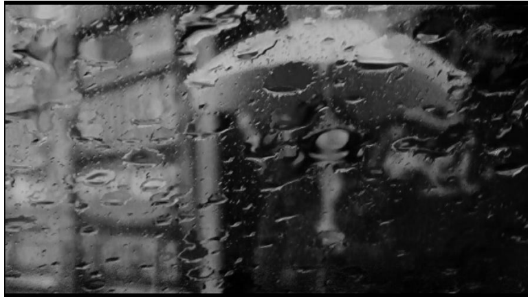
Figura 2: Frame do filme Medianeras - O olhar mediado pelo aparelho.

Mariana, personagem da obra analisada, confirma as características do flâneur ao folhear o popular livro “Onde Está Wally?”: