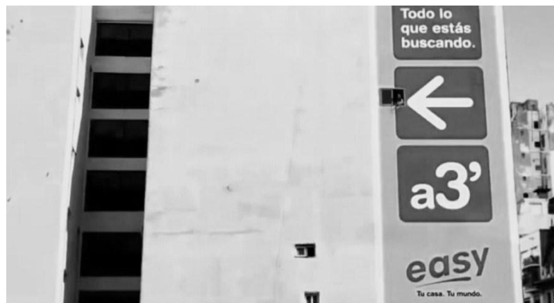
Figura 3: Frame do filme Medianeras : As medianeras representam rotas de fuga, mas que frustram os olhares.

Diante de um olhar oprimido, dentro de suas casas, os moradores da Buenos Aires de Taretto, acabam por encontrar a luz que procuram na tela do computador. “Como podemos ter deixado de acreditar em nossos próprios olhos para crer tão facilmente nos vetores da representação eletrônica e, sobretudo, no vetor velocidade da luz?” (VIRILIO, 1993, p.31).