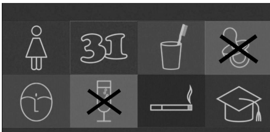
Figura 4: Frame do filme Medianeras : Ícones que caracterizam o sujeito no ciberespaço.

O mundo constituído pelo uso de códigos comunicacionais, segundo Bally (1951), aceita a linguagem como expressão de pensamentos e acrescenta que como sistema de pensamento, a linguagem deforma-se pela subjetividade. Sendo assim, ela não reflete e sim refrata a realidade e opera uma modificação dos fenômenos. A subjetividade é a parte afetiva que nos constitui. Emoções, impulsos e desejos são expressos na linguagem. Ao considerar uma linguagem afetiva, não se exclui a condição social do interlocutor, pois ela transita de um estado psicológico para o social.