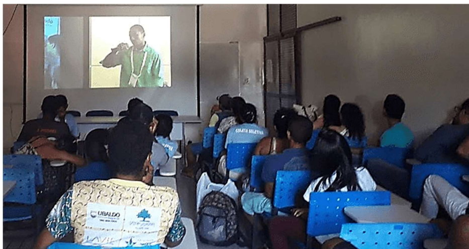
Figura 3 - Oficina sobre empreendedorismo realizada com os catadores das associações ASCARE-JP e Acordo Verde em 2018.

Em 2018 deu-se continuidade ao projeto. Durante um levantamento inicial sobre temas que gostariam que fossem abordados nas oficinas, percebeu-se que para os catadores é mais interessante um auxílio financeiro, material e direto do que algo que contribua na formação teórica. Isso é compreensível, visto que trabalham e vivem em condições precárias. Muitos, por exemplo, chegam a caminhar cerca de duas ou três horas de casa para o galpão, inclusive em dias chuvosos, pois não possuem dinheiro nem para a passagem de ônibus. Com isso, a oficina foi adiada para o período final (Figura 3), como uma forma de concluir o projeto, e as ações voltaram-se mais para o contato com as empresas, pela possibilidade de oferecer resultados mais concretos.