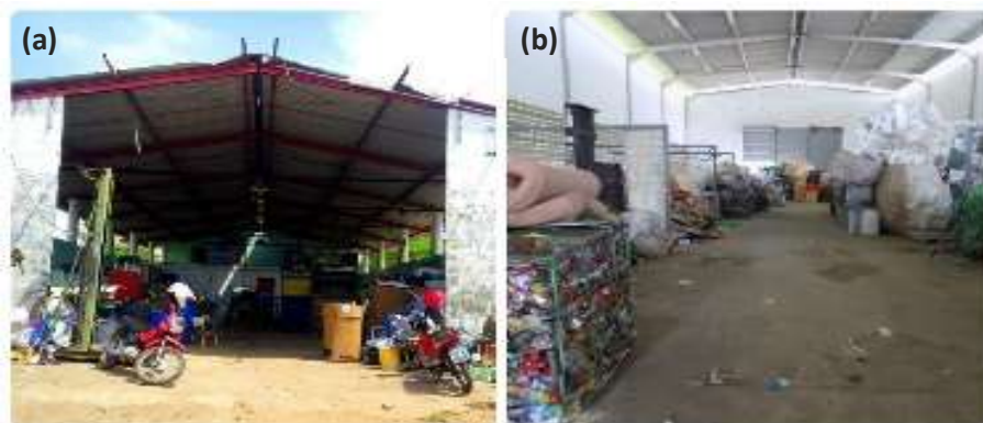
Figura 1 - Galpões das associações ASCARE-JP (a) e Acordo Verde (b).

As coletas são feitas com carros de mão ou caminhão nas residências e comércios próximos aos polos. Os moradores fazem um acordo simbólico, onde entram com a separação do lixo e a associação com a coleta porta a porta feita pelos agentes ambientais, antigos catadores informais. Esse acordo garantiu a inclusão social dos agentes ambientais, ajuda na preservação do meio ambiente e contribui para deixar a cidade mais limpa e organizada (PMJP, 2017).