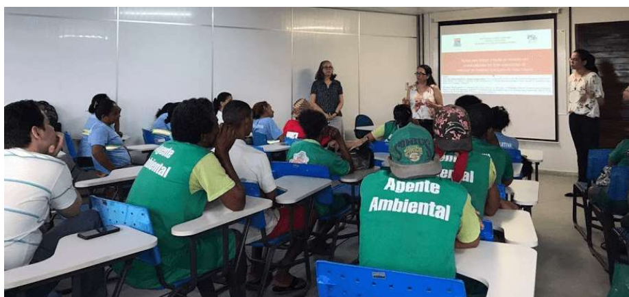
Figura 2 - Apresentação dos resultados do projeto para os catadores das associações ASCARE-JP e Acordo Verde em 2017.

A apresentação desses dados para os catadores foi realizada no dia 14 de dezembro de 2017, em uma sala de aula da Universidade Federal da Paraíba (UFPB) (Figura 2). O traslado dos catadores ocorreu através do micro-ônibus disponibilizado pelo Centro de Tecnologia da UFPB. O momento teve início às 9h30min e término às 12h. Também foram apresentados a equipe e o objetivo do projeto e abordados os aspectos relacionados às propriedades, aplicação, separação e processamento dos materiais escolhidos.