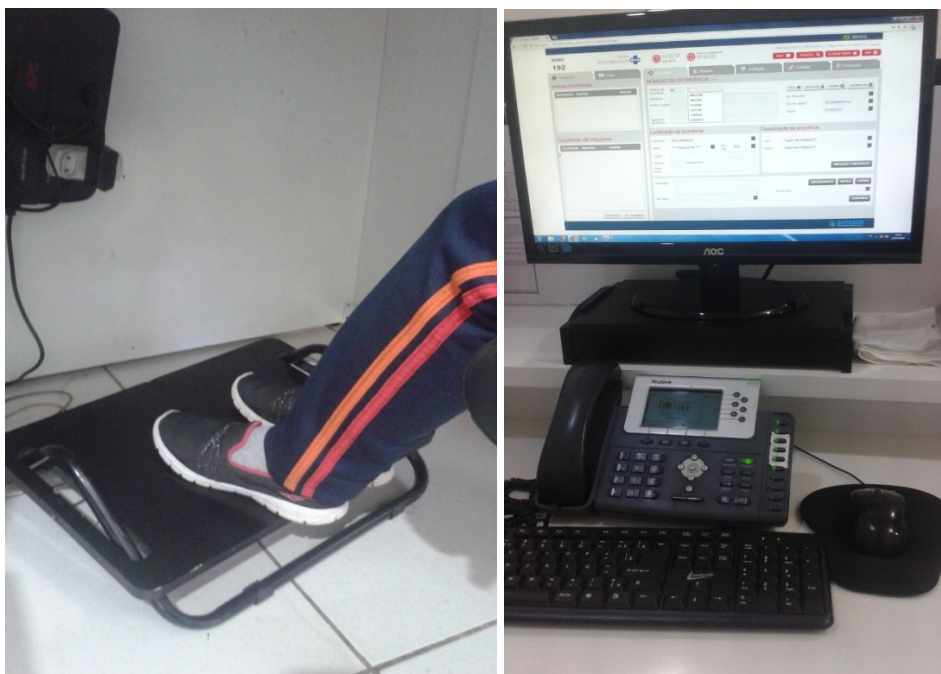
Figura 3 - Dispositivo de apoio para os pés e posto de trabalho melhorado

As adequações ergonômicas implementadas foram as seguintes: novo monitor (auxiliando no gerenciamento das viaturas no pátio), apoio para pés, apoio para punhos, adequações de altura por dispositivos em monitores. A FIGURA 3 apresenta as ferramentas disponibilizadas para os trabalhadores.