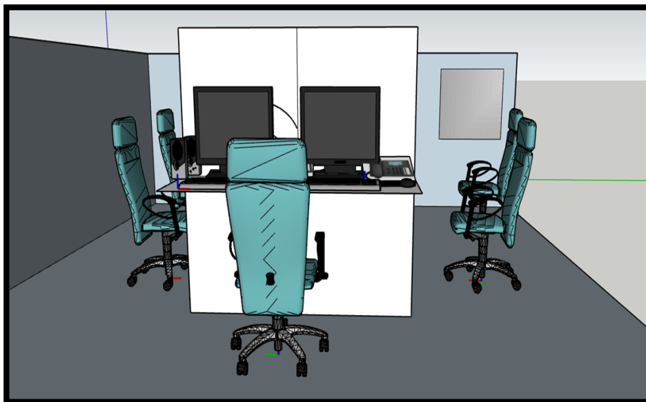
Figura 2 - Mobiliários e equipamento dos atendentes do S.A.M.U