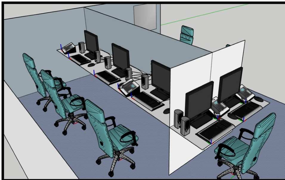
Figura 1- Perspectiva da sala da central de atendimento do S.A.M.U