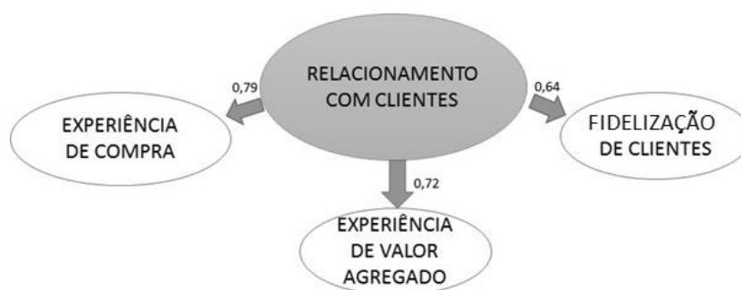
Figura 1 - Representação da estrutura fatorial obtida

No tocante ao fator de segunda ordem, este foi denominado Relacionamento com Clientes, e é formado pelos três fatores de primeira ordem supracitados. A Figura 1 traz uma representação visual da estrutura fatorial obtida, onde o fator de segunda ordem, relacionamento com o cliente, explica a variância comum dos fatores de primeira ordem.