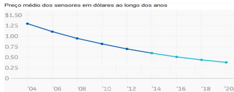
Figura 3 – Redução do custo médio dos sensores