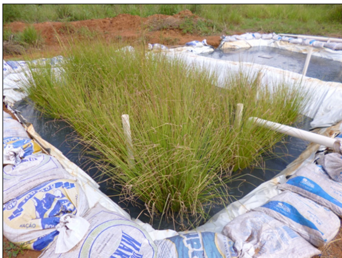
Figura 1 - Estação experimental para tratamento de RS em alagados construídos

A célula vegetada foi denominada de WC e a outra, de célula ou tanque controle.