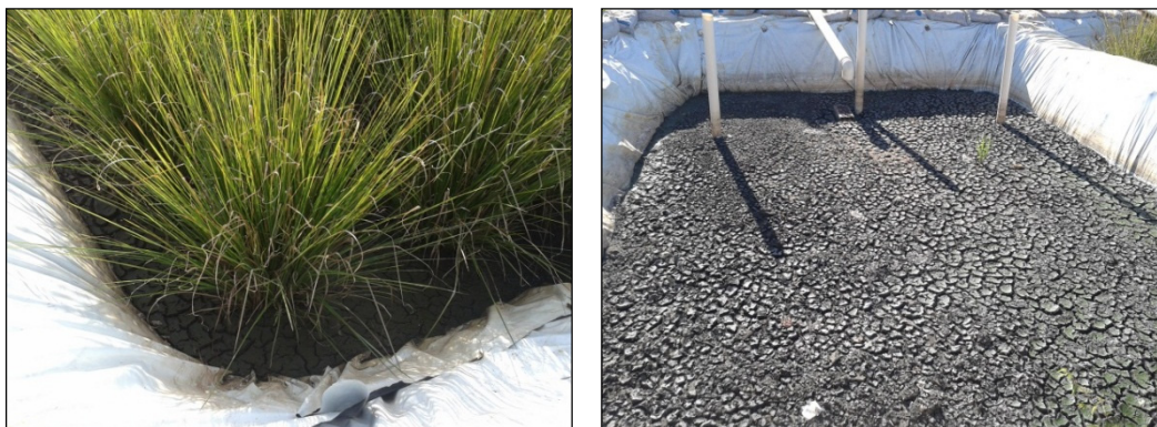
Figura 4 - Imagem representativa de ambos os leitos de tratamento com destaque para o lodo acumulado após diversas aplicações de RS