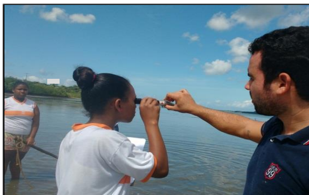
Figura 2- Alunos utilizando o salinômetro para verificar a salinidade da água em pontos distintos do estuário.

As atividades de campo permitiram o contato direto com o ambiente, possibilitando que o estudante se envolvesse e interagisse em situações reais das discussões em sala. Assim, estimularam a curiosidade, a participação em grupo (Figuras 2 e 3) e o reconhecimento do ambiente, acrescentados de novas percepções.