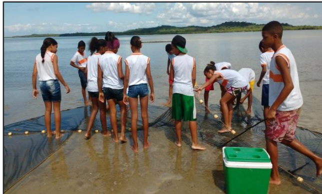
Figura 3- Estudantes observando os animais capturados em amostras no estuário próximo à comunidade de Jiribatuba.