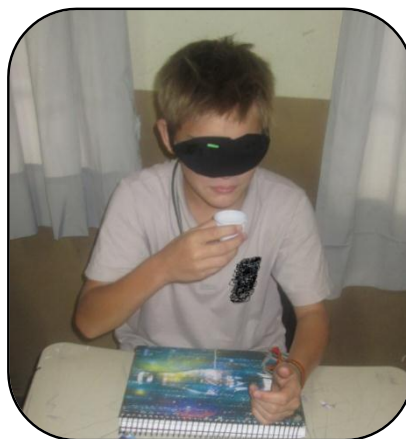
Figura 1 – Estudante degustando o suco para adivinhar o sabor e o preparo.

Iniciamos o projeto interdisciplinar com uma dinâmica intitulada “Degustação às Cegas” para inserir os estudantes no contexto dos rótulos alimentícios e chamar a atenção para o conteúdo conceitual de proporcionalidade. O objetivo da dinâmica era descobrir o sabor do suco pelo paladar e identificar a preparação: forte, fraco ou ideal (padrão – como indicado no rótulo). Os estudantes tiveram seus olhos vendados para não ver a coloração do suco, pois este evidenciava o sabor e de algum modo o tipo de preparo do suco. A figura 1 apresenta um estudante degustando o suco para adivinhar o sabor e o preparo.