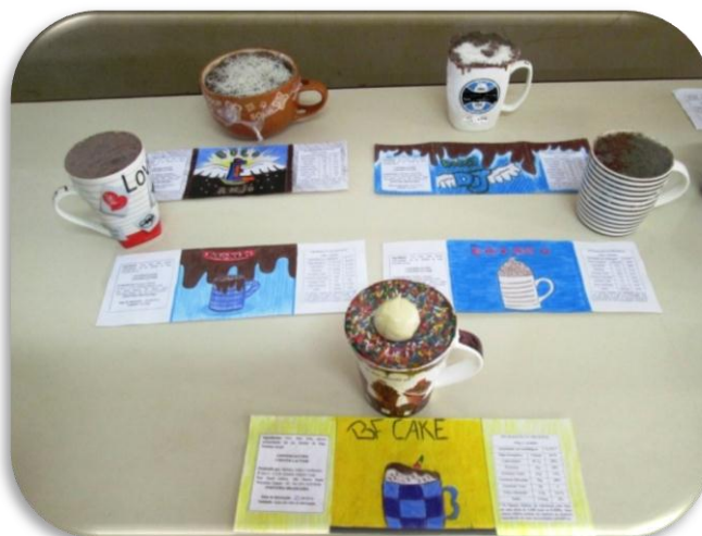
Figura 4 – Produto final. Produção de um bolo de caneca com rótulo.

Etapa 8 - Elaborar uma síntese da Ilha de Racionalidade produzida: Na etapa final produzimos um bolo de caneca e elaboramos os rótulos com imagem, tabela nutricional, validade, fabricação, ingredientes, entre outras informações, conforme figura 4.