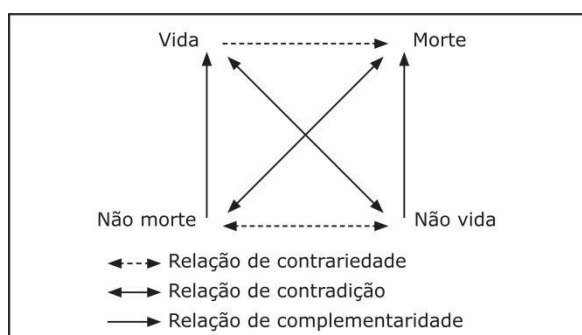
FIGURA 1: exemplo básico do quadrado semiótico

Nível fundamental – nível que estabelece o eixo semântico sobre o qual o conteúdo se constrói e que, através do quadrado semiótico (exemplificado a seguir), representa graficamente a sintaxe das transformações que ocorrem entre os termos. Essa sintaxe fundamenta-se em relações de contrariedade, contradição e implicação, que são as responsáveis pelas articulações mínimas de uma narrativa.