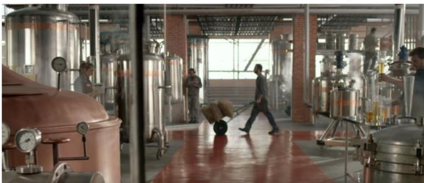
FIGURA 2 – Cena que mostra o contexto da fábrica (40”)