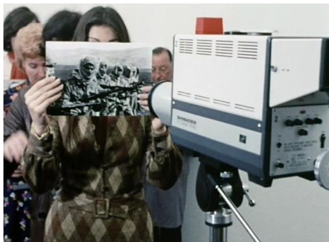
FIGURA 17 – Ici et ailleurs