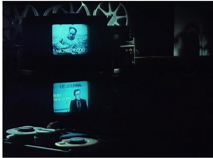
FIGURA 9 – Numéro deux