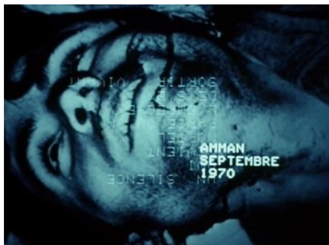
FIGURA 21 – Ici et ailleurs