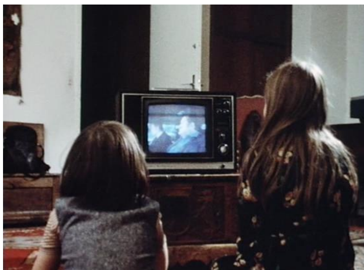
Figura 4 – Ici et ailleurs

Isto também é presenciado nos filmes subsequentes. Em Comment ça va , mãe e filha frente à televisão (FIGURA 5), e em Numéro deux a família toda, três gerações, cada qual buscando uma programação diferente (FIGURA 6).