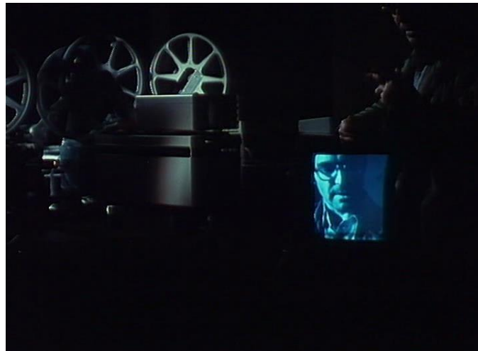
FIGURA 11 – Numéro deux