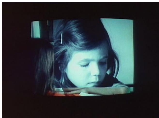
FIGURA 18 – Numéro deux

roteiro, ensaio, documentário ou ficção, mas é transformado tudo em cinema, inclusive o texto animado que na tela surge e assume força narrativa.