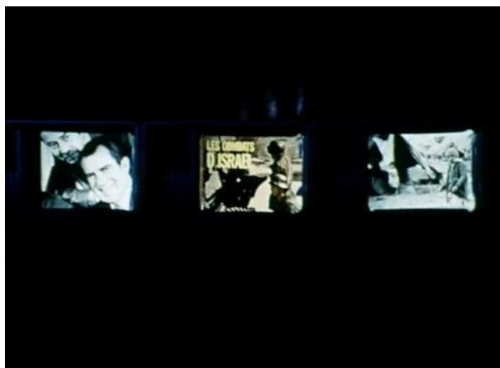
FIGURA 7 – Ici et ailleurs

de uma nova imagem a partir da mescla daquelas projetadas e da inserção de um agente posto a sua frente, sobretudo, na ilha de edição (FIGURA 11 e FIGURA 12); 3) Sua intensificação a ponto de levar à montagem de uma videoinstalação que não possui relação diegética alguma com o desenvolvimento dramático do filme (FIGURA 13) ou ainda imagens em que o aparelho televisivo assume caráter cênico, mesmo que meramente “gráfico” (FIGURA 14).