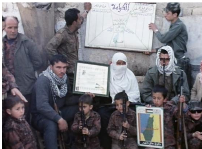
Figura 1 – Ici et ailleurs

Ici et ailleurs trata basicamente da relação entre o “nós” e o “eles”, ou seja, a dimensão que nos separa de outro povo em um mesmo período histórico, e o que nos leva a ser o que somos “aqui” e eles “acolá”, como o próprio título sugere. Retrata, entre o documental e o encenado (não menos fidedigno ao real e nem mais manipulado do que aquele), o cotidiano de uma família francesa contraposto a núcleos populacionais palestinos em meio ao confronto com os israelenses. A zona de conforto de uma família francesa que assiste o mundo através de seus noticiários televisivos, vivendo com seus confrontos tipicamente ocidentais e uma expressa passividade é colocada frontalmente ao modus vivendi de um palestino da segunda metade do século XX, em que o tema central de sociabilidades é o sentido comunitário, pátrio e de luta, como vemos inclusive com as cenas de reunião dos fedayeen e de instrução militar de crianças, homens e mulheres (FIGURA 1).