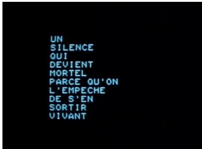
FIGURA 20 – Ici et ailleurs

imagem. Assim, a utilização de créditos videográficos serve como narração e orientação em distinção aos elementos sonoros e imagéticos, somando-se ou trabalhando dialeticamente, para um sentido comum.