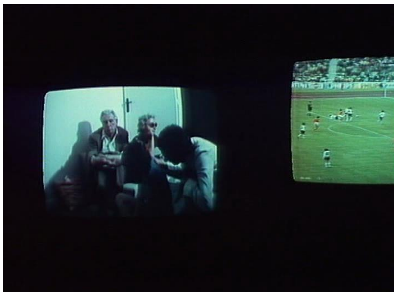
FIGURA 6 – Numéro deux

A “re-filmagem” do conteúdo enquanto nós o vemos juntamente com os personagens postos na diegese, é uma contribuição de Godard que foi possibilitada pelas peculiaridades técnicas do vídeo. Assim como as famílias assistem o mundo, nós assistimos também as coisas pelo olhar do outro, no caso, o olhar de Godard, e esta relação metalinguística é levada à discussão mais intensa em Ici et ailleurs , como em voice-over ouvimos neste filme: