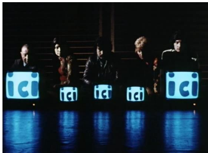
FIGURA 13 – Ici et ailleurs