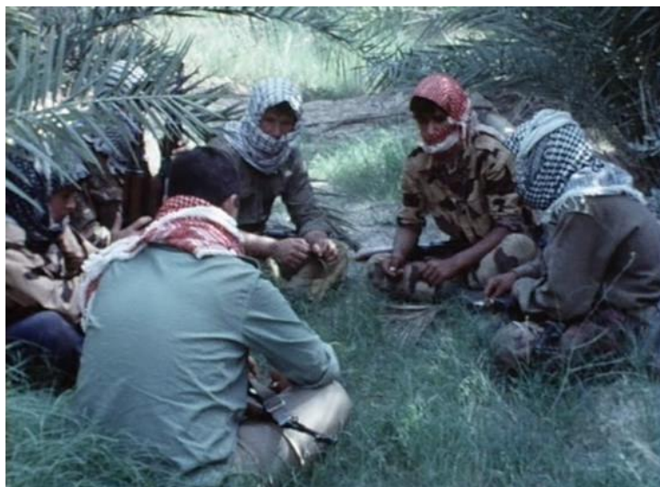
Figura 2 – Ici et ailleurs