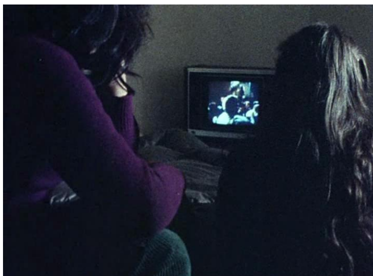
FIGURA 5 – Comment ça va

Isto também é presenciado nos filmes subsequentes. Em Comment ça va , mãe e filha frente à televisão (FIGURA 5), e em Numéro deux a família toda, três gerações, cada qual buscando uma programação diferente (FIGURA 6).