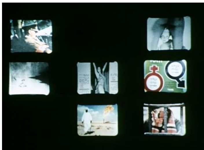
FIGURA 8 – Ici et ailleurs