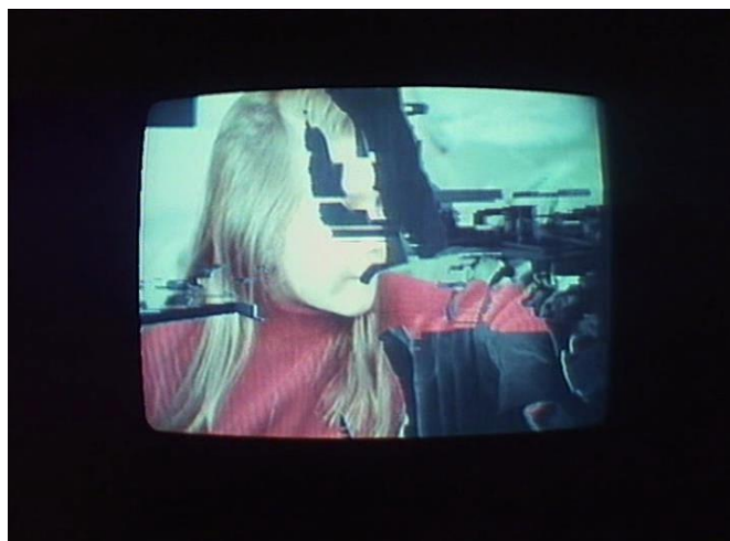
FIGURA 16 – Numéro deux

A imagem de um plano se dilui em seu contra-plano (FIGURA 17) ou mesmo em um plano distinto que o sucederia em uma montagem convencional. Neste próximo registro, o casal, após ter relações sexuais, conversa na cama, e vemos uma alternância das camadas que ora nos mostra o rosto da mulher ora o do homem.