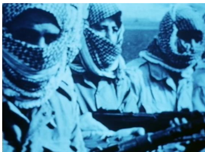
FIGURA 16 – Ici et ailleurs

Em meio a estes paradoxos retratados em Ici et ailleurs , como a situação Ocidente versus Oriente, Revolução Árabe e seus paralelos com a Revolução Francesa, os que lutam versus os que assistem o telejornal, ou ainda em Comment ça va , um filme como o próprio diretor o define, “entre o ativo e o passivo”, no qual vemos a força editorial e a ordem do discurso que seleciona ou deseleciona determinado tópico a ser registrado e difundido ou negligenciado entre o público através da mídia impressa, podemos ver uma desconstrução audiovisual, uma análise e uma composição metalinguística, aonde o cinema/vídeo é o meio e o fim, o objeto e o processo. Vemos em uma parte de Ici et ailleurs uma imagem dos fedayeen palestinos e após narrações sugestivas (mais do que explicativas) a vemos sendo captada pela câmera, segurada por um personagem do filme, enquanto o narrador over nos explica o modo fabril de lidar com as imagens e permeá-las de sentido e credibilidade, num viés de total desconstrução daquilo que o próprio filme havia construído minutos antes (figuras 24 e 25).