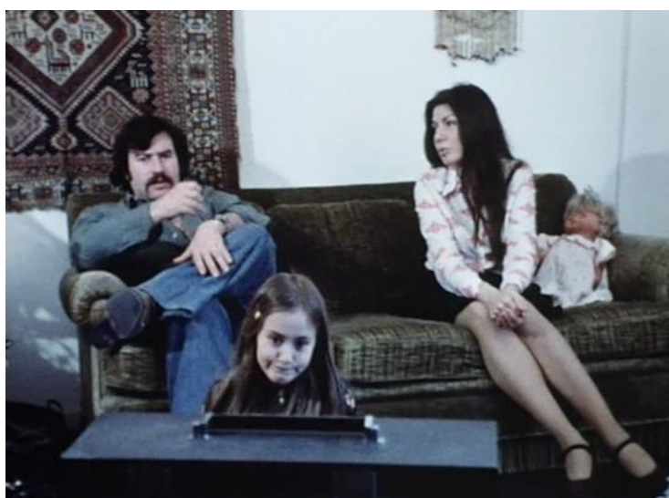
Figura 3 – Ici et ailleurs