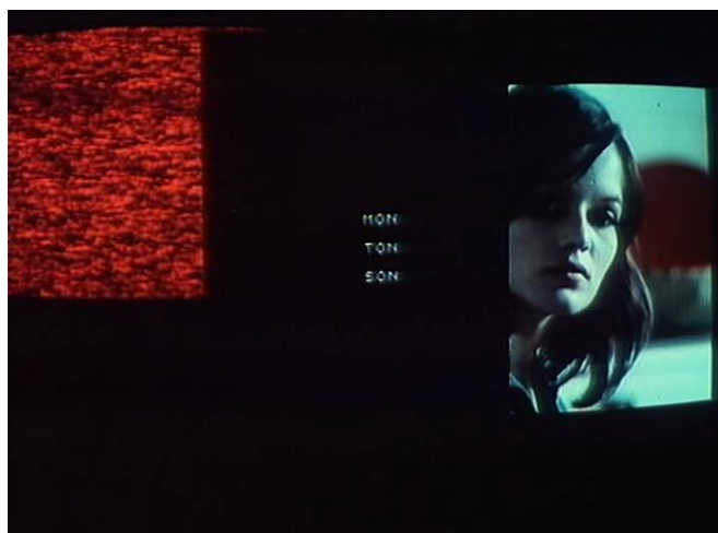
FIGURA 14 – Numéro deux

Em posse do vídeo, outra forma que ganhou premência no trabalho de Godard foi a construção das imagens não em linha, ou seja, sequencialmente concebidas como no cinema, com um frame após o outro, mas de forma simultânea, em contínuo, com camadas que se sobrepõem na chamada incrustação. Plano e contra-plano agora não eram mais transmitidos sequencialmente, em ritmo de montagem, mas ao mesmo tempo em uma única imagem que oscilava entre transparência destas camadas dando ênfase a uma ou a outra, mas que se construía ao mesmo tempo que eram vistas e exibidas. Isto é exemplificada pela cena impactante de Numéro Deux (FIGURA 15 e FIGURA 16) na qual o ato sexual dos pais é visto pela filha, e temos um “plano” do casal mesclado a outro do rosto da criança.