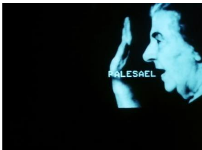
FIGURA 22 – Ici et ailleurs

Em meio a estes paradoxos retratados em Ici et ailleurs , como a situação Ocidente versus Oriente, Revolução Árabe e seus paralelos com a Revolução Francesa, os que lutam versus os que assistem o telejornal, ou ainda em Comment ça va , um filme como o próprio diretor o define, “entre o ativo e o passivo”, no qual vemos a força editorial e a ordem do discurso que seleciona ou deseleciona determinado tópico a ser registrado e difundido ou negligenciado entre o público através da mídia impressa, podemos ver uma desconstrução audiovisual, uma análise e uma composição metalinguística, aonde o cinema/vídeo é o meio e o fim, o objeto e o processo. Vemos em uma parte de Ici et ailleurs uma imagem dos fedayeen palestinos e após narrações sugestivas (mais do que explicativas) a vemos sendo captada pela câmera, segurada por um personagem do filme, enquanto o narrador over nos explica o modo fabril de lidar com as imagens e permeá-las de sentido e credibilidade, num viés de total desconstrução daquilo que o próprio filme havia construído minutos antes (figuras 24 e 25).