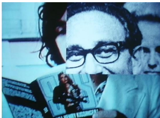
FIGURA 19 – Ici et ailleurs

Quanto aos textos utilizados (FIGURA 20, FIGURA 21 E FIGURA 22), eles surgem na tela como uma frase em criação, como fluxo de pensamento do diretor sendo dito e expressado ao mesmo tempo que vem a sua mente. Não são mais apenas elementos extra-diegéticos que servem para definir o recorte temporal e espacial no qual se desenvolve a “história” ou mera nomenclatura de funções, mas se tornam componentes estéticos e linguísticos de função “narrativa” utilizados em uma composição comum de sentido da obra, mesclados ou alternados com imagens estáticas ou em movimento. “As imagens e as palavras são então tratadas como se tivessem o mesmo estatuto, sem diferença de classe [...] Ver, pensar e escrever não mais se distinguem, e tudo passa pelo vídeo” (DUBOIS, 2004, p. 276-283). O texto e suas formas, ou seja, a palavra escrita, sua visualidade, seu traço e as representações a ela atribuída, sempre estiveram presentes na filmografia de Godard, quando víamos livros abertos rabiscados, paredes com escritas e pichações ou personagens segurando cartazes. Com o vídeo, Godard explorou então o texto animado, com ele surgindo, sendo feito, sendo dito e escrito ao mesmo tempo em que se torna um componente fílmico ganhando status de