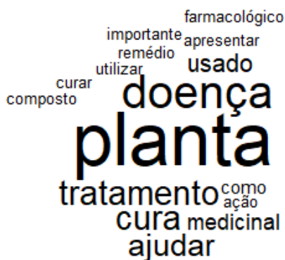
Figura 1 - Nuvem de palavras do Iramuteq, a partir das definições de plantas medicinais na percepção de alunos do 3º ano do ensino médio.

A nuvem de palavras sobre o entendimento do que são plantas medicinais evidenciou que os termos mais frequentes foram: planta, doença, tratamento, cura e medicinal, entre as palavras menos citadas estão: farmacológico, remédio e composto (Figura 1). Os contextos são exemplificados pelos trechos em que as plantas medicinais foram definidas pelos alunos como: “Aqueles que são usadas em tratamentos de doenças ou dores cotidianas (A25)”, “Ajudam na cura ou tratamento de várias doenças (A20)”, “[...] são aquelas que apresentam ação farmacológica, ou seja, ajudam na cura ou tratamento de várias doenças (A5)”.