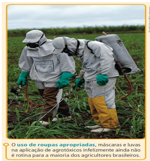
Figura 2 – Profissionais del campo utilizando EPP