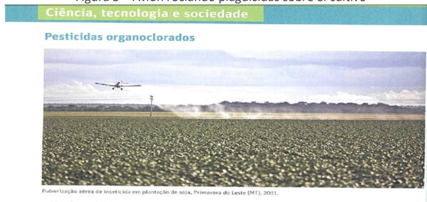
Figura 3 – Avión rociando plaguicidas sobre el cultivo

Como ejemplo de ilustración que probablemente no aportaría beneficios a la comprensión del texto, no permitiendo así la construcción del aprendizaje, podemos citar la figura de la página 136 del Libro B, Volumen 3, que muestra una foto de un avión de aspersión en el tramo del capítulo que discute el uso de plaguicidas organoclorados (Figura 3).