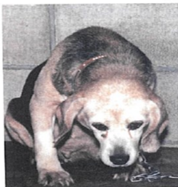
Figura 5 - Perro en el sexto día de una prueba LD 50

Sintomas de um cão no sexto dia de um teste DL50: convulsão, dificuldade respiratória, hemorragia da mucosa ocular e incapacidade para ficar em pé. DL50 é uma abreviatura do termo inglês Lethal Dose 50 Percent (dose letal 50%) para um teste criado em 1920, com a finalidade de detectar a quantidade de substância que provocará a morte da metade de um grupo de animais, num determinado intervalo de tempo. Esse teste portanto mede a toxicidade de certas substâncias, incluindo os aditivos para alimentos.